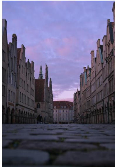
Die Giebelhäuser am Prinzipalmarkt

Die Promenade ist die grüne Verkehrsader von Münster und umschließt die Innenstadt. Sie wird gerne als Joggingstrecke und Spazierweg benutzt.